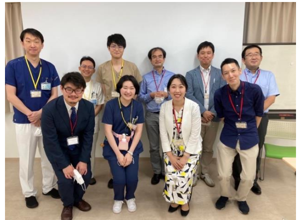
サイトビジット&ポートフォリオ検討会にて

内部でポートフォリオ検討会の場を設けることが難しい少数専攻医プログラムを主な対象として、毎年数回実施しています。1人あたり30分程度の持ち時間で、他プログラムの指導医・専攻医も加わり、あえて少人数の心理的に安全な環境で、研修中に経験した症例の振り返りを支援し、ポートフォリオ作成に繋がります。今年も時期が近くなれば各プログラムへご案内します。