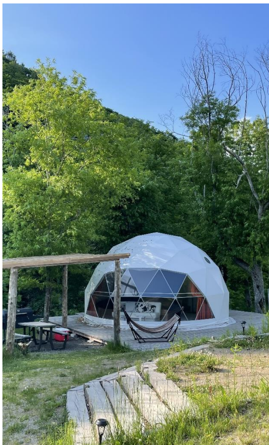
アニマルグランピング・ノースサファリサポロ

最後に、いつもお忙しいなか会場確保や準備作業をお願いしている事務局の皆様改めて感謝申し上げます。